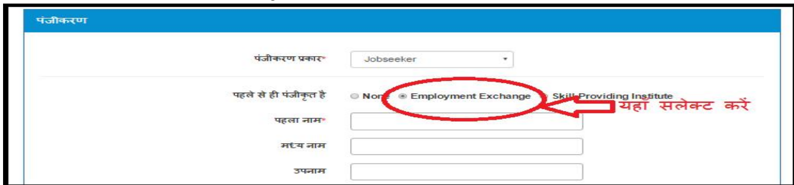
चित्र क्रमांक : 6

यदि आप मध्यप्रदेश के जिला रोजगार में पंजीकृत हैं तो यहाँ " Employment Exchange " सलेक्ट करें ।(चित्र क्रमांक : 6)